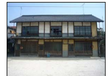
窓が割れ、放置されている空家