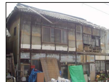
長期間人が住んでいない空家